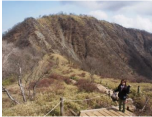
丹沢山～蛭ヶ岳コース

相模原市には神奈川県最高峰の蛭ヶ岳(1673m)はじめ丹沢の山があり、登山コースも多くあります。